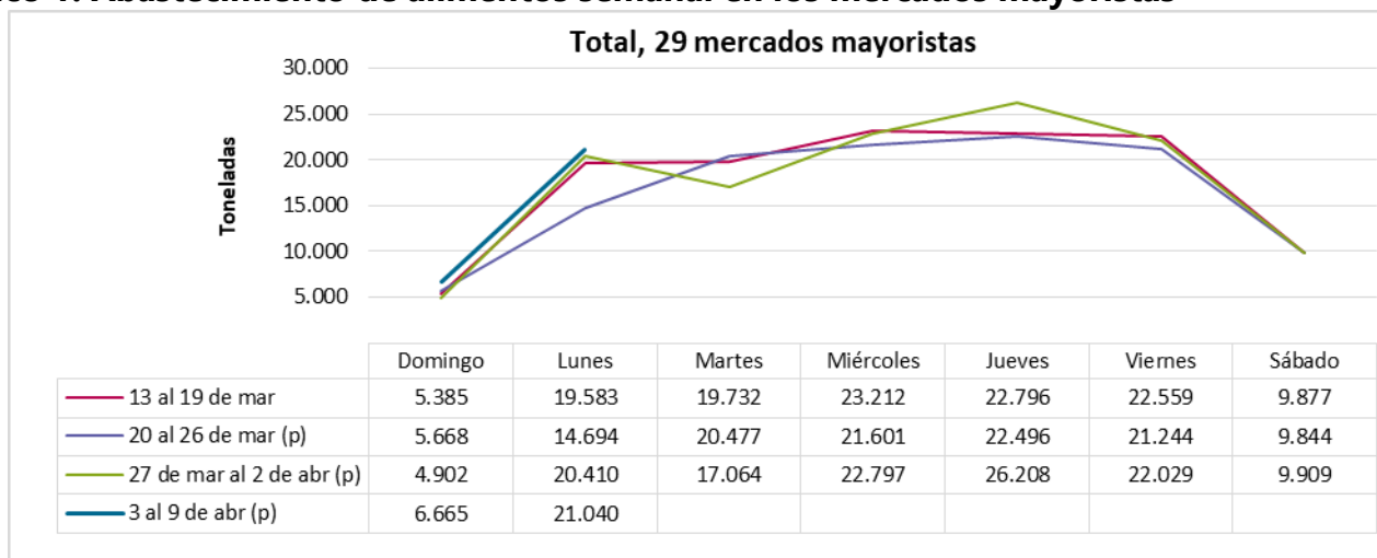
Gráfico 1. Abastecimiento de alimentos semanal en los mercados mayoristas

El abastecimiento para el total de los 29 mercados mayoristas que cubre el SIPSA_A y para la ciudad de Barranquilla se observa en los siguientes gráficos.