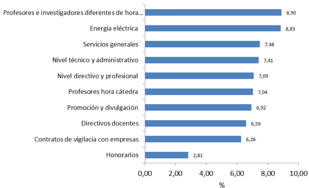
Gráfico 1 ICES. Variación anual por principales clases de costo, según contribución. Segundo semestre 2016