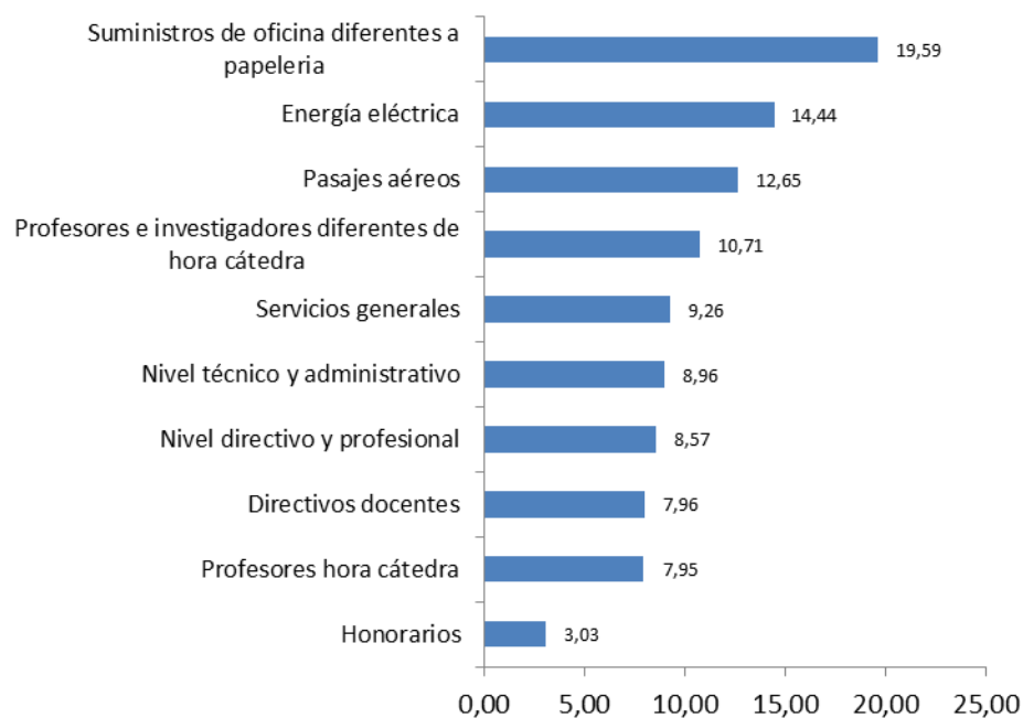
Gráfico 2 ICES. Principales variaciones anuales por clases de costo, según contribución. Primer semestre 2016