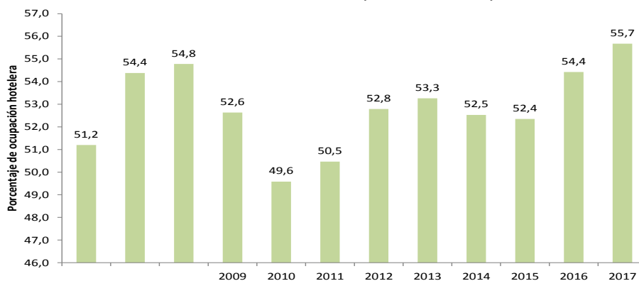
Porcentaje de ocupación hotelera doce meses 2006 – 2017 (abril - marzo)