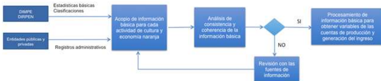
Diagrama 1. Proceso de validación de las fuentes de información

El diagrama 1 representa de manera secuencial, el proceso de validación de las fuentes de información antes de iniciar el método de cálculo.