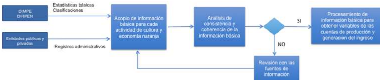
Diagrama 1. Proceso de validación de las fuentes de información

El diagrama 1 representa de manera secuencial, el proceso de validación de las fuentes de información antes de iniciar el método de cálculo.