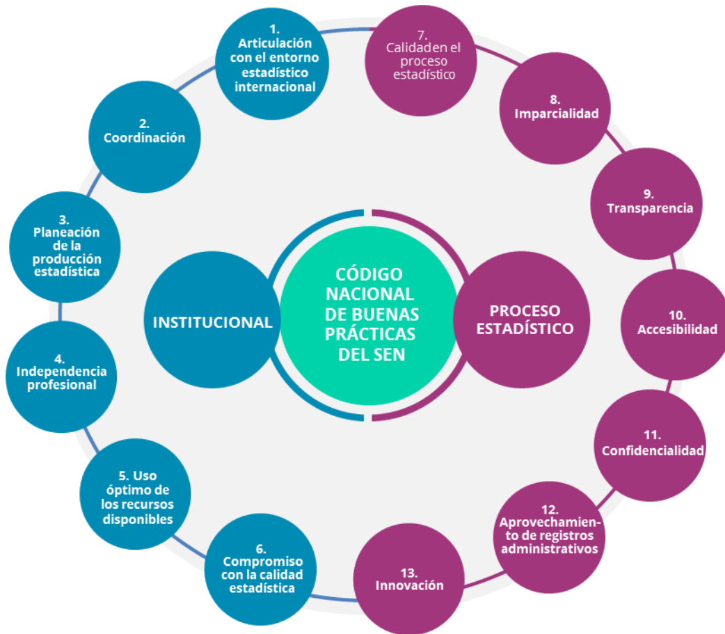
Diagrama 1. Estructura del Código Nacional de Buenas Prácticas

Los dos entornos concebidos en el Código se entienden como: