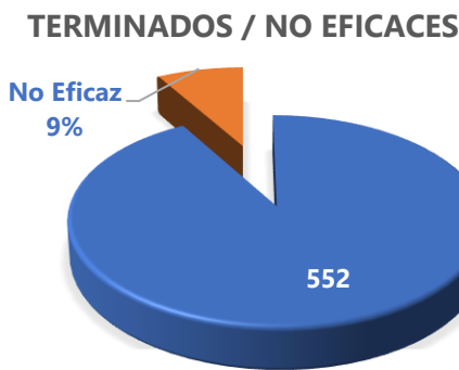
Grafica 2. PM Terminados y Evaluados como no Eficaces.

6.4.2. Por otra parte, del seguimiento realizado, se ha identificado que los siguientes procesos no han atendido lo dispuesto en la actividad diecisiete (17) del procedimiento "SEGUIMIENTO Y EVALUACIÓN DE PLANES DE MEJORAMIENTO (PM)" que precisa: "De no ser eficaz el PM, la OCI le notificará al Líder de proceso, Director Técnico o Director Territorial, con copia a OPLAN, la necesidad de formular un nuevo PM que resuelva la(s) causa(s) del hallazgo(s)".