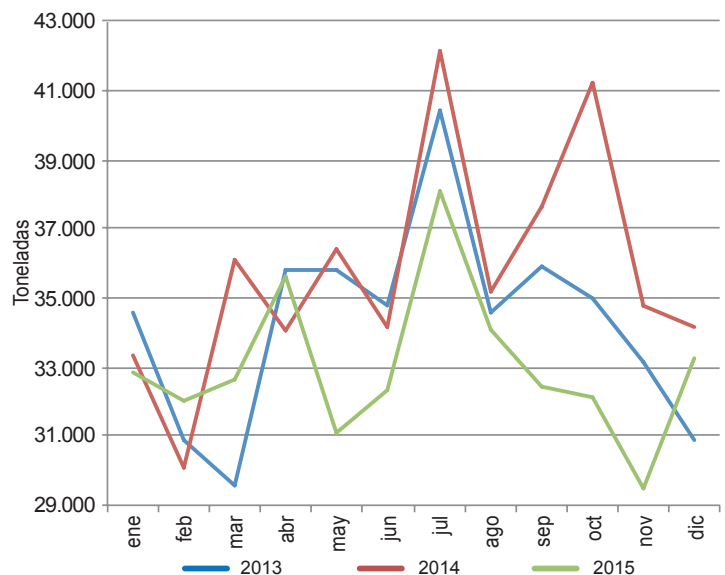
Gráfico 2. Abastecimiento de alimentos del Valle de Cauca 2013 - 2015

En el grupo de las frutas, el Valle del Cauca ofrece un portafolio muy diversificado de productos llegando a las 429.778 t. Es así como las frutas más representativas fueron las piñas con 63.902 t que llegaron procedentes desde Dagua, Restrepo, Caicedonia y La Unión. La papaya maradol reportó 54.176 t procedente principalmente del municipio de La Unión. En el caso de los cítricos se acopiaron 37.714 t, destacándose la producción de naranja Valencia y limón Tahití procedentes de Caicedonia, Sevilla, Andalucía, Tuluá y La Unión.