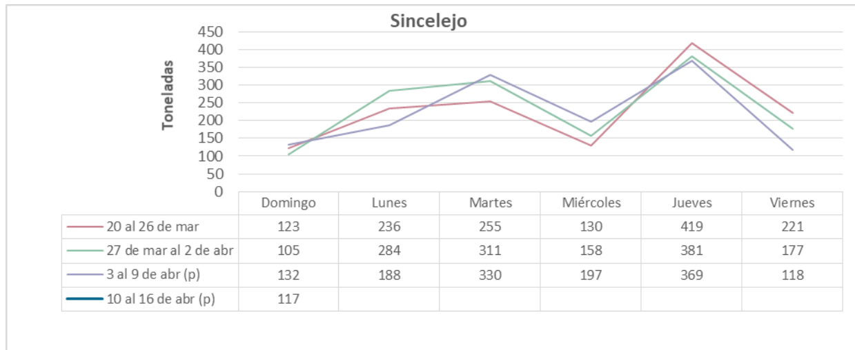
Gráfico 2. Abastecimiento de alimentos semanal en Sincelejo*