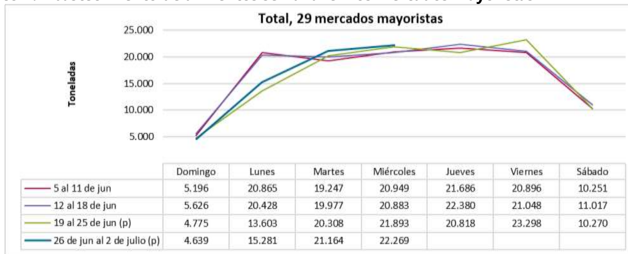
Gráfico 1. Abastecimiento de alimentos semanal en los mercados mayoristas

El abastecimiento para el total de los 29 mercados mayoristas que cubre el SIPSA_A y para la ciudad de Popayán se observa en los siguientes gráficos.