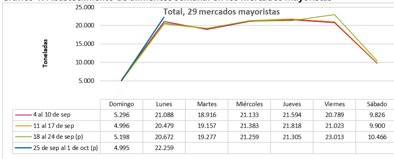
Gráfico 1. Abastecimiento de alimentos semanal en los mercados mayoristas

El abastecimiento para el total de los 29 mercados mayoristas que cubre el SIPSA_A y para la ciudad de Bogotá se observa en los siguientes gráficos.