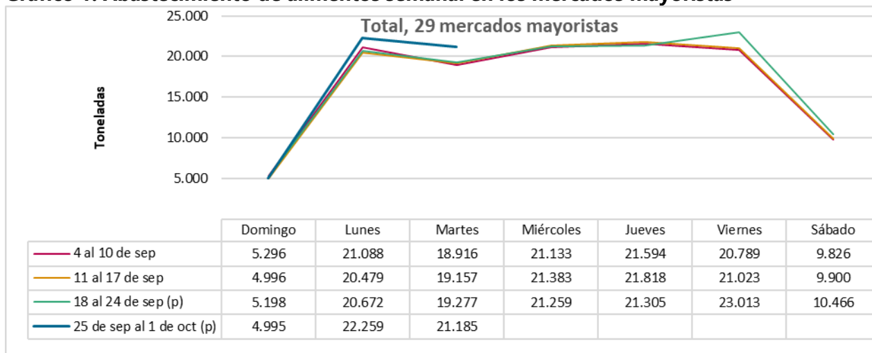
Gráfico 1. Abastecimiento de alimentos semanal en los mercados mayoristas

El abastecimiento para el total de los 29 mercados mayoristas que cubre el SIPSA_A y para la ciudad de Sincelejo se observa en los siguientes gráficos.