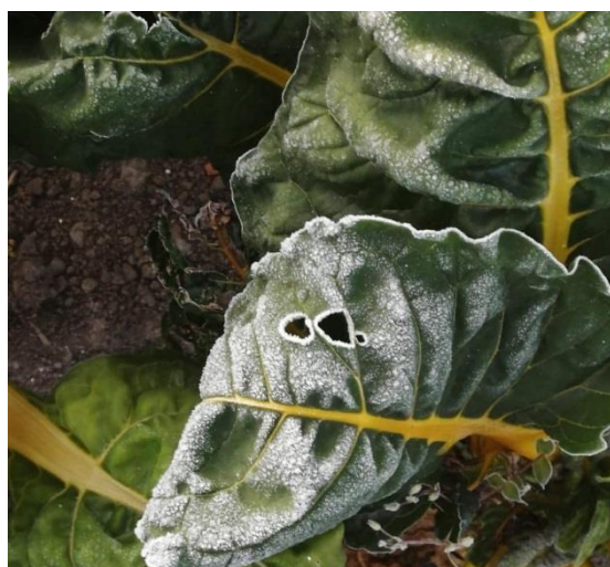
Alcega cultivada en la Sabana de Bogotá