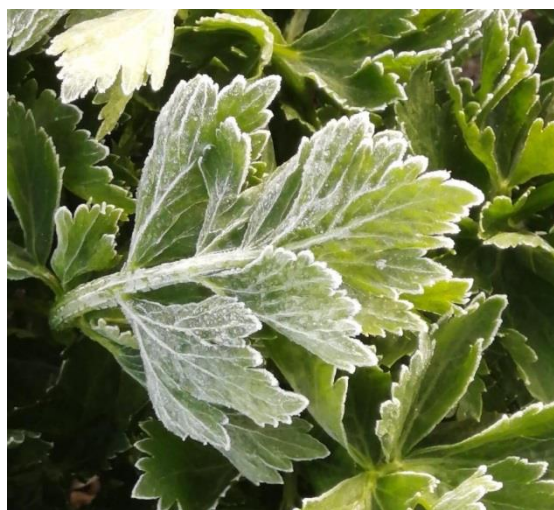
Apio cultivado en la Sabana de Bogotá

afectados y se redujo el ingreso de producto de primera calidad a la central de abastos, lo que ocasionó un alza en los precios. En el caso del brócoli, por ejemplo, el kilo se ofreció a $5.567, lo que representó un aumento de la cotización del 62,16% frente a la semana inmediatamente anterior.