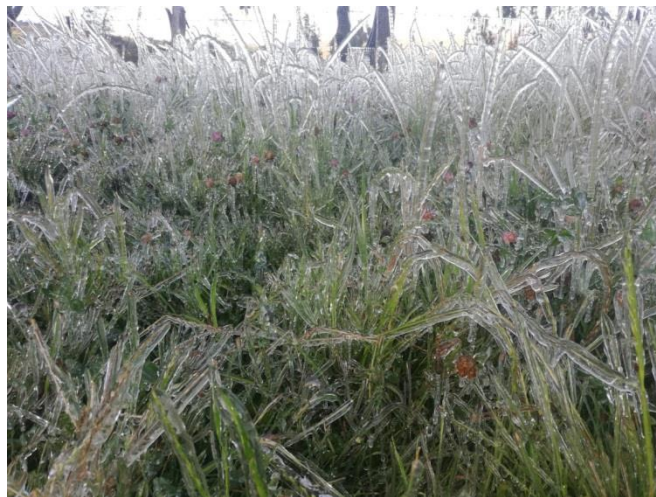
Cebolla junca cultivada en Aquitania (Boyacá)

En Duitama, uno de los productos que más se vio afectado a causa de los cambios climáticos fue el apio oriundo de Tibasosa, Duitama y Santa Rosa de Viterbo (Boyacá). Allí, el alza superó el 70,00% esta semana, ofreciéndose el kilo a $867.