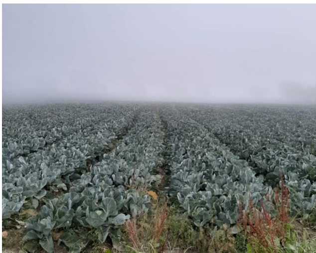
Repollo cultivado en Tenjo (Cundinamarca)

En Tunja, subió la cotización del apio porque hubo menor abastecimiento de primera calidad desde Funza, Madrid, Mosquera y Cajicá (Cundinamarca). El kilo se vendió esta semana a $760, 4,97% más que la semana del 31 de enero.