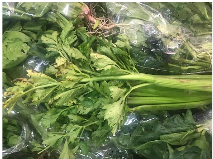
Apio en mercado de Bogotá