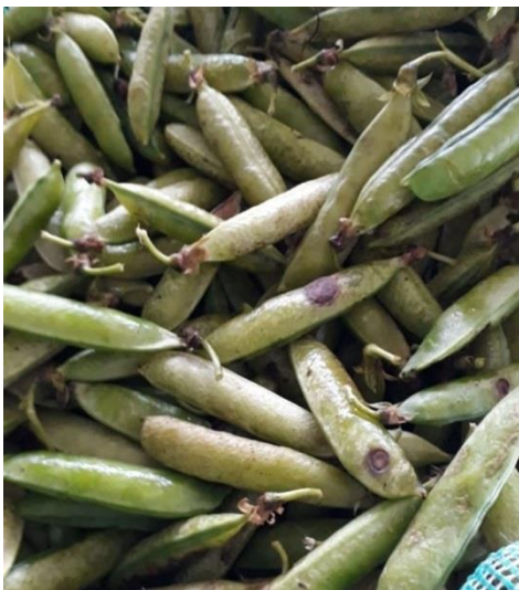
Arveja verde en vaina pastusa

En la capital de Antioquia se reportó un alza en los precios de rábano rojo, la remolacha y el repollo blanco. En el caso del rábano rojo, los cultivos están presentando inconvenientes por las altas temperaturas en el departamento de Antioquia, lo que ha hecho que el producto llegue de muy baja calidad.