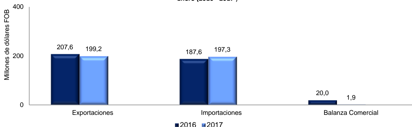
Balanza Comercial en Zonas Francas Enero (2016 - 2017)