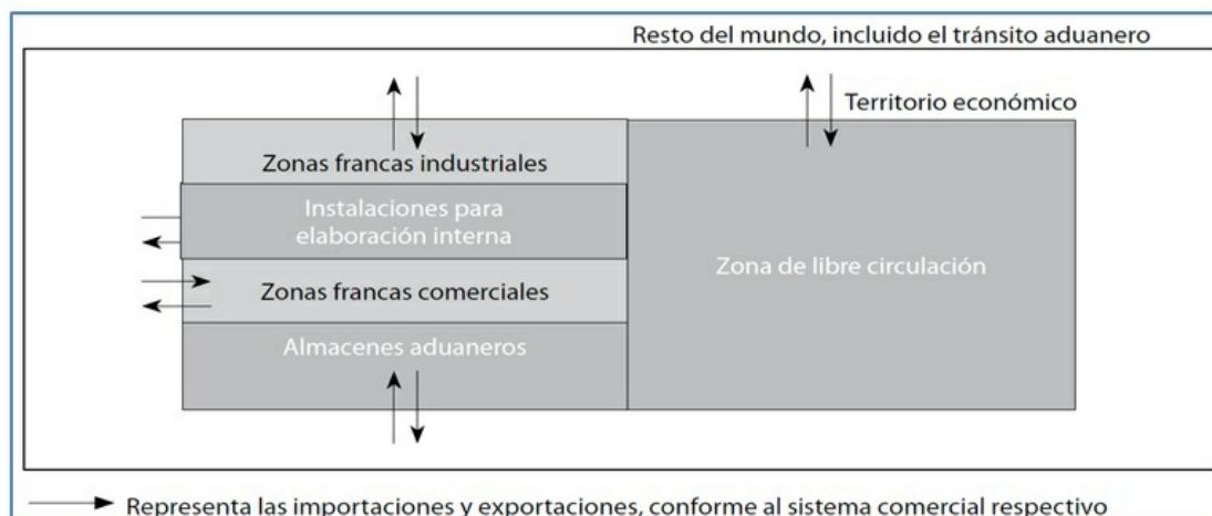
Gráfico 1. Elementos territoriales y posibles importaciones y exportaciones según el sistema comercial general