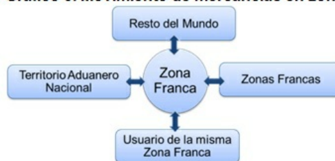
Gráfico 3. Movimiento de mercancías en zonas francas

Las estadísticas del movimiento y comercio exterior de mercancías en ZF abarca todo el movimiento legal de ingresos y salidas de mercancías con el resto del mundo, el territorio aduanero nacional, otras ZF y usuarios de la misma ZF.