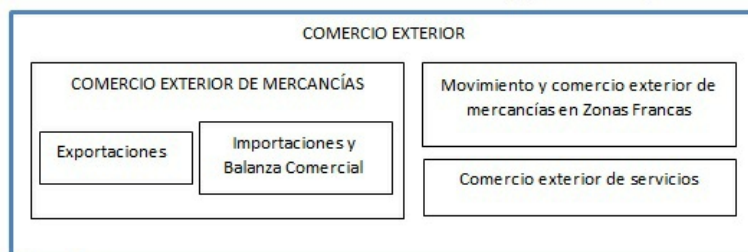
Gráfico 4. Información estadística de comercio exterior, producida por el DANE

La información estadística de comercio exterior producida por el DANE, está conformada por las siguientes investigaciones: