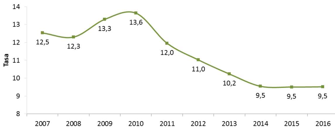
Tasa de desempleo de los cónyuges Total nacional Enero - diciembre (2007-2016)