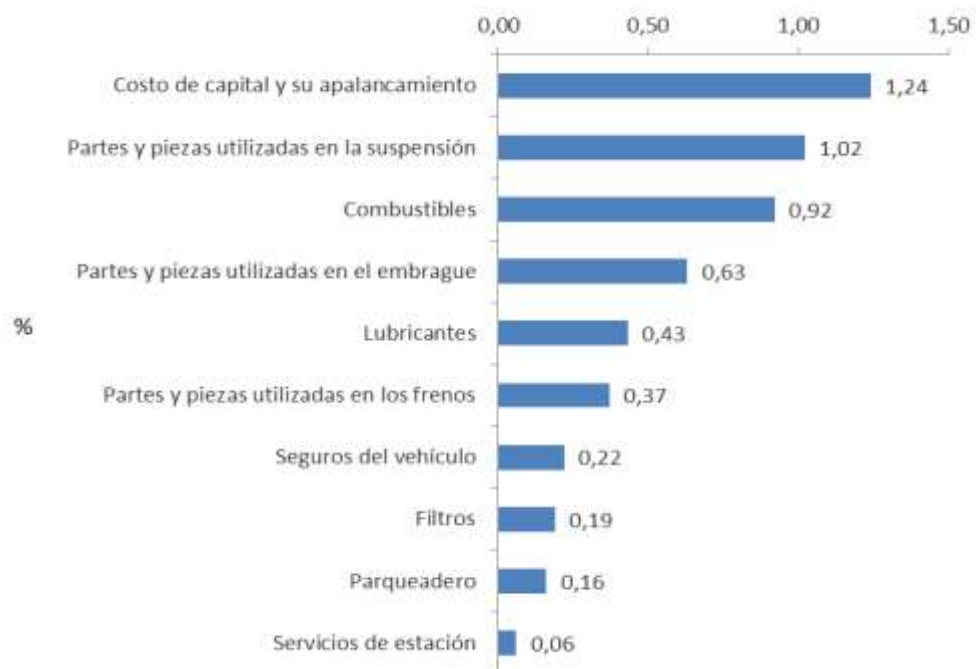
Gráfica 1 ICTC. Variación mensual por principales clases de costo Mayo 2016