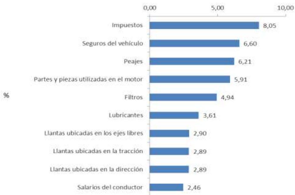
Gráfica 2 ICTC. Variación año corrido por clase de costo Mayo 2016