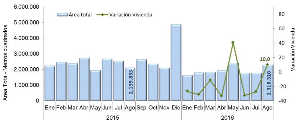
Area Total Licenciada y Variación Anual del Area para Vivienda 302 municipios 2015-2016 (agosto)