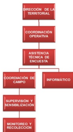
Gráfico 2. Esquema operativo ECAS