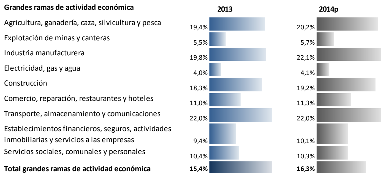
Gráfica 2. Relación de los insumos importados en el total de consumos intermedios

En contraste, la gran rama de actividad electricidad, gas y agua presentó la menor participación con 4,0 % y 4,1 % para 2013 y 2014 p .