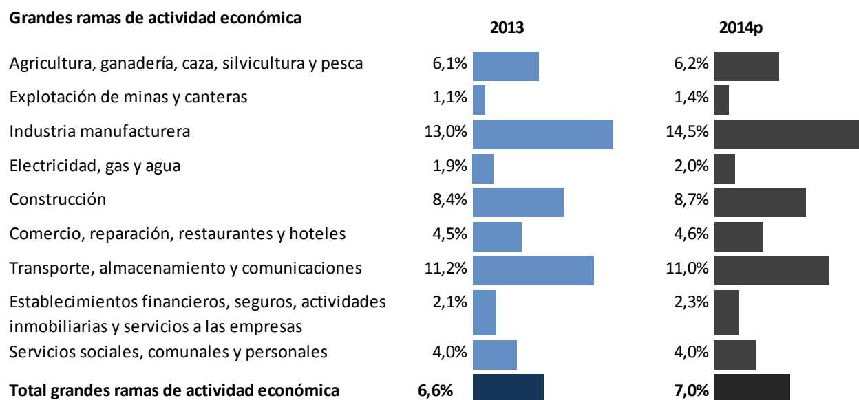
Gráfica 1. Grado de dependencia consumo intermedio importado

Por el contrario, la gran rama de actividad explotación de minas y canteras presentó el menor grado de dependencia, registrando para los años 2013 y 2014 p , 1,1% y 1,4%, respectivamente.