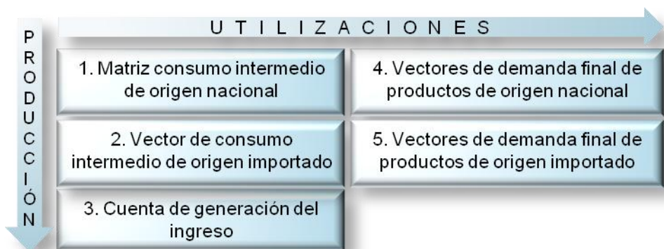
Gráfico 1. Estructura de la matriz insumo producto

Vista en columnas, la MIP describe las funciones de producción, que se componen de los consumos intermedios desagregados en los de origen nacional (1) e importado (4) y de la cuenta de generación del ingreso (3), la cual presenta las correspondientes remuneraciones al factor trabajo, capital y los impuestos. La matriz de consumo intermedio de origen nacional refleja la interdependencia existente entre las unidades de producción, en la medida en que cada función de producción define a su vez la unidad que le provee los consumos intermedios necesarios para dicha producción.