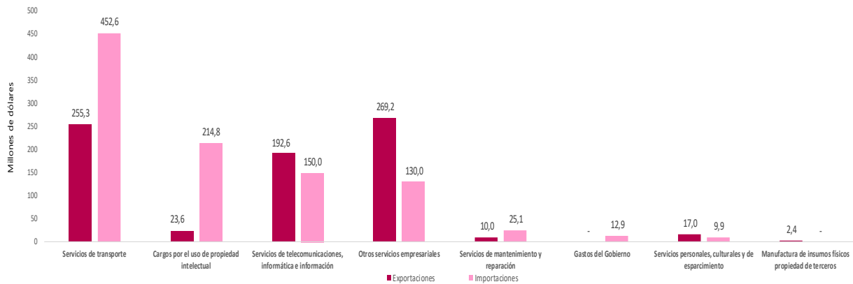
Gráfico 1. Valor de las exportaciones e importaciones según agrupación CABPS 1 Millones de dólares. Marzo de 2026 P