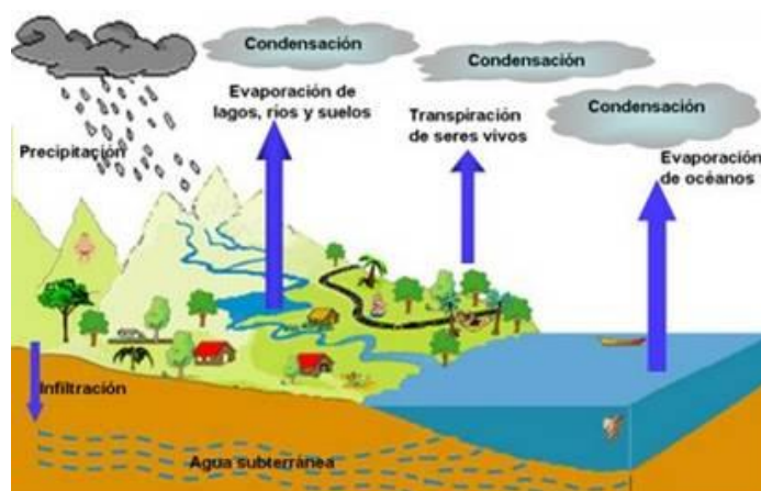
Figura 1. Ciclo hidrológico